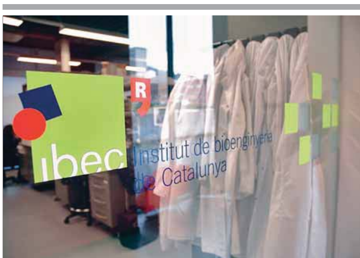
A les instal·lacions de l'IBEC la incorporació al BIST és 'vox populi'