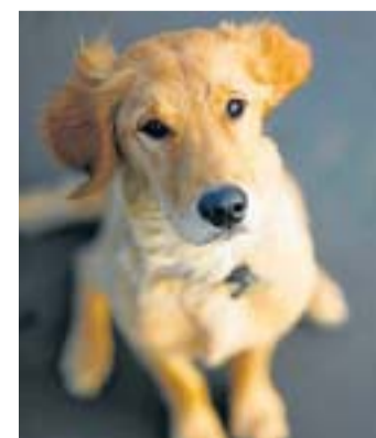
És el primer animal gros que es cura de diabetis.

La teràpia és molt poc invasiva. En una sola sessió es posen diverses injeccions a les potes del darrere de l'animal. Així s'introdueixen vectors de teràpia gènica que tenen un doble objectiu: per una banda, expressar el gen de la insulina, per l'altre, actuar sobre la glucoquinasa, un enzim que actua com un regulador de la captació de glucosa de la sang. Quan els dos gens actuen simultàniament actuen com a sensor de la glucosa: aconsegueixen una regulació automàtica de la captació de la glucosa de la sang i redueixen així la hiperglucèmia diabètica (l'excés de glucosa associat a la malaltia). La teràpia, que utilitza una nova generació de vectors, també ha demostrat que és segura.