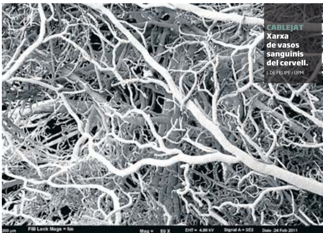
CABLEJAT Xarxa de vasos sanguinis del cervell. J. DE FELIPE / UPM

i classificar millor les malalties i els trastorns mentals, sovint diagnosticats pels símptomes i no per la base biològica. La demència afecta a Europa 6,3 milions de persones. No totes tenen el mateix tipus de demència. Sovint no es pot precisar. Quan es disposi d'un cervell virtual acurat també es podran provar molècules per desvetllar el seu potencial terapèutic abans d'iniciar assajos clínics. Així mateix, es podran desenvolupar noves tècniques de neuroimatge per al diagnòstic precoç.