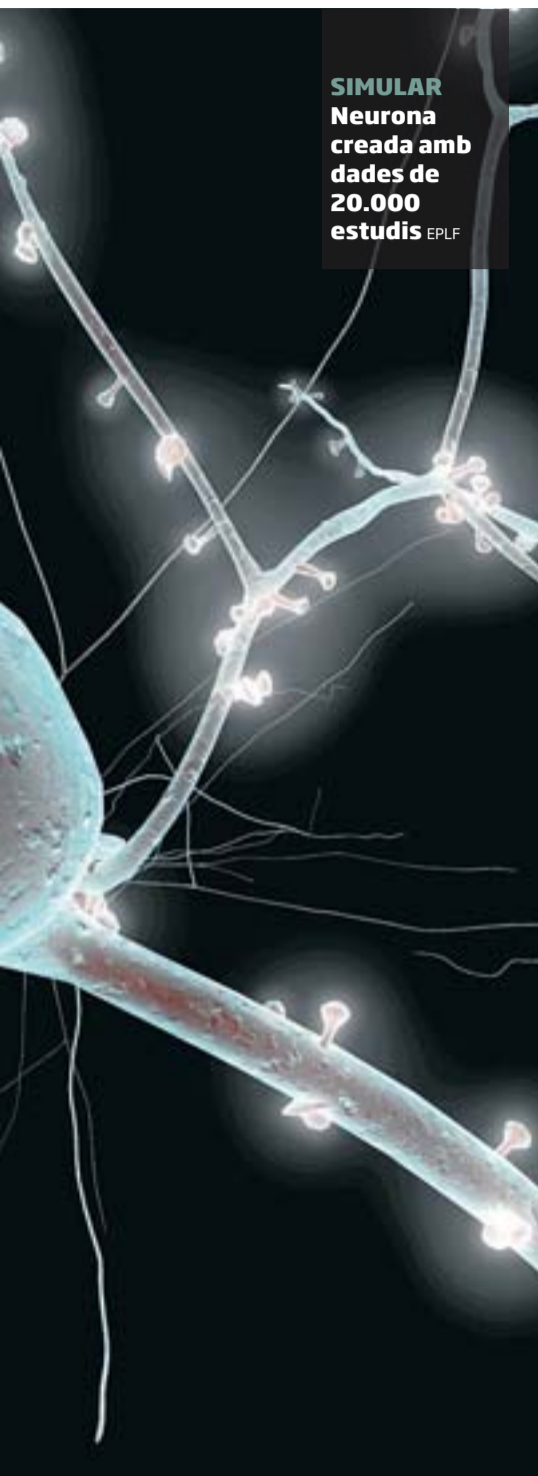
SIMULAR Neurona creada amb dades de 20.000 estudis EPLF